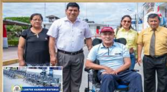
ENTREGA DE SILLAS DE RUEDAS Y BASTONES CANADIENSES A LAS PERSONAS MÁS VULNERABLES DE NUESTRA PROVINCIA