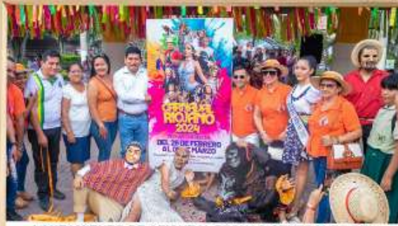
LANZAMIENTO DE AFICHE Y FECHAS CENTRALES DEL CARNAVAL RIOJANO 2024