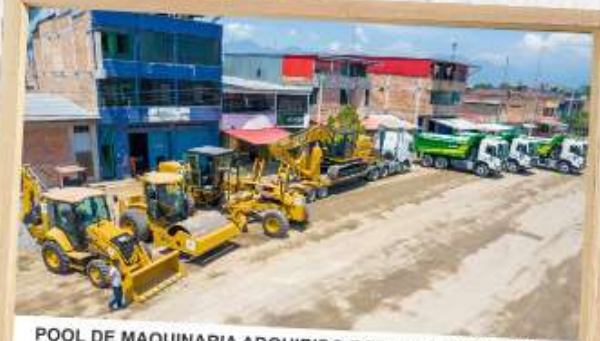
POOL DE MAQUINARIA ADQUIRIDO POR LA MUNICIPALIDAD PROVINCIAL DE RIOJA (GESTIÓN 2023 - 2026)