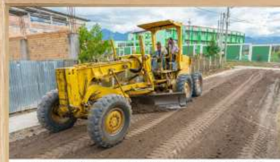
MEJORAMIENTO DE CALLES Y ACCESOS EN TODA LA PROVINCIA DE RIOJA