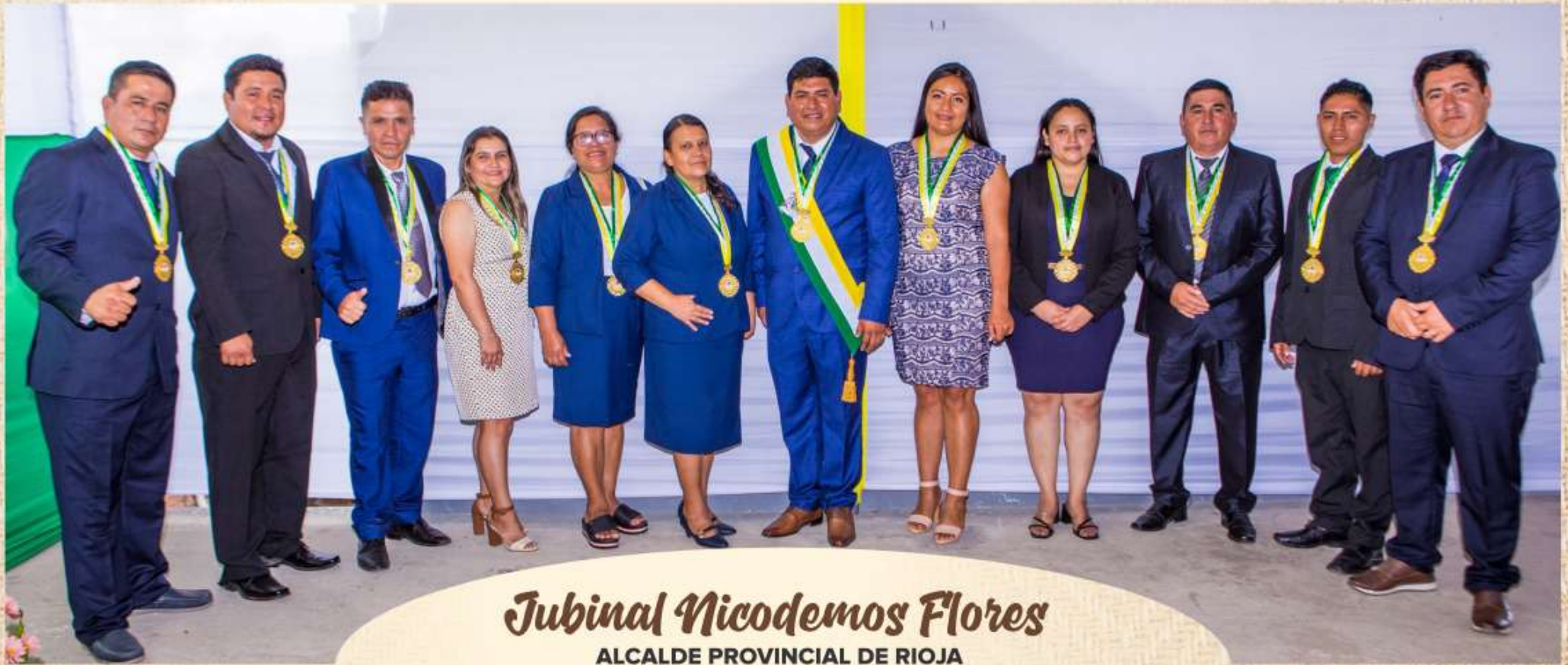
Jubinal Nicodemos Flores ALCALDE PROVINCIAL DE RIOJA