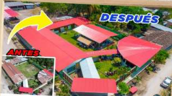
CONSTRUCCIÓN DE COBERTURA; REMODELACIÓN DE AULAS DE EDUCACIÓN INICIAL EN EL SECTOR RUPACUCHA - RIOJA