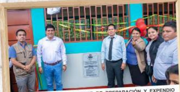
CONSTRUCCIÓN DE AMBIENTE DE PREPARACIÓN Y EXPENDIO DE ALIMENTOS Y SALA DE USOS MÚLTIPLES EN LA I. E. N° 001085 - AGUAS VERDES, DISTRITO DE PARDO MIGUEL - NARANJOS, PROVINCIA DE RIOJA, REGIÓN SAN MARTÍN