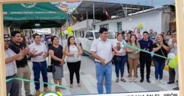
MEJORAMIENTO DEL SERVICIO DEMOVILIDAD URBANA EN EL JIRÓN CHACHAPOYAS, CUADRAS 10, 11 Y 12 DE LA CIUDAD DE RIOJA