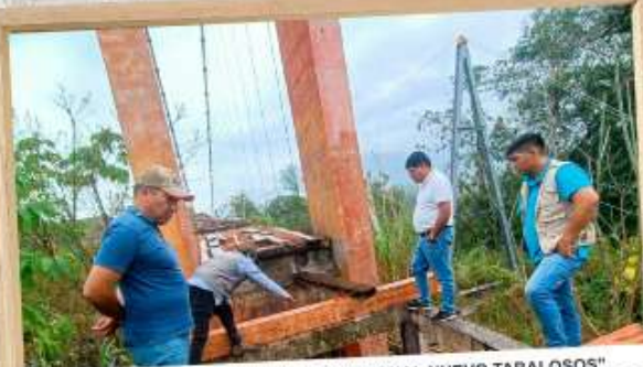
MEJORAMIENTO DEL "PUENTE PEATONAL NUEVO TABALOSOS" EN EL CASERÍO DE "NUEVO TABALOSOS" DEL DISTRITO DE YORONGOS