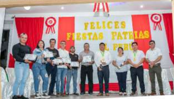
RECONOCIMIENTO A NUESTROS RIOJANOS DESTACADOS.